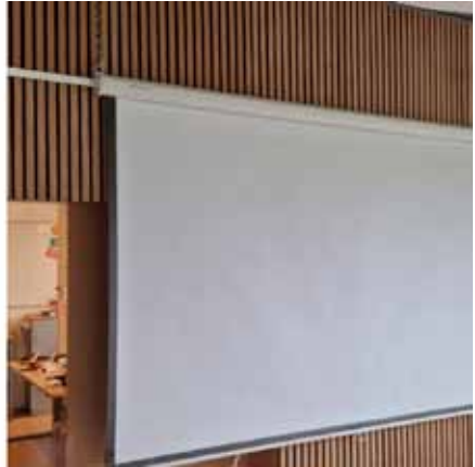
LT-Treff – Ausstattung mit Beamer und Leinwand für Vorträge und Präsentation

Unser mittlerweile sehr beliebter LT-Treff für alle Arten von Zusammenkünften und Feierlichkeiten ist um eine weitere Ausstattung reicher: Im Februar haben wir dort einen Beamer und eine Leinwand installiert, um Präsentationen und Themenabende aber auch gemeinsame Sport-Live-Ereignisse dort veranstalten zu können. Auch für die Nutzung von Seminaren und Vortragsangeboten bietet diese Ergänzung zusätzliche Möglichkeiten – ob für externe Nutzer oder für LT-eigene Zwecke für Team- und Trainings-Workshops – alles wird möglich!