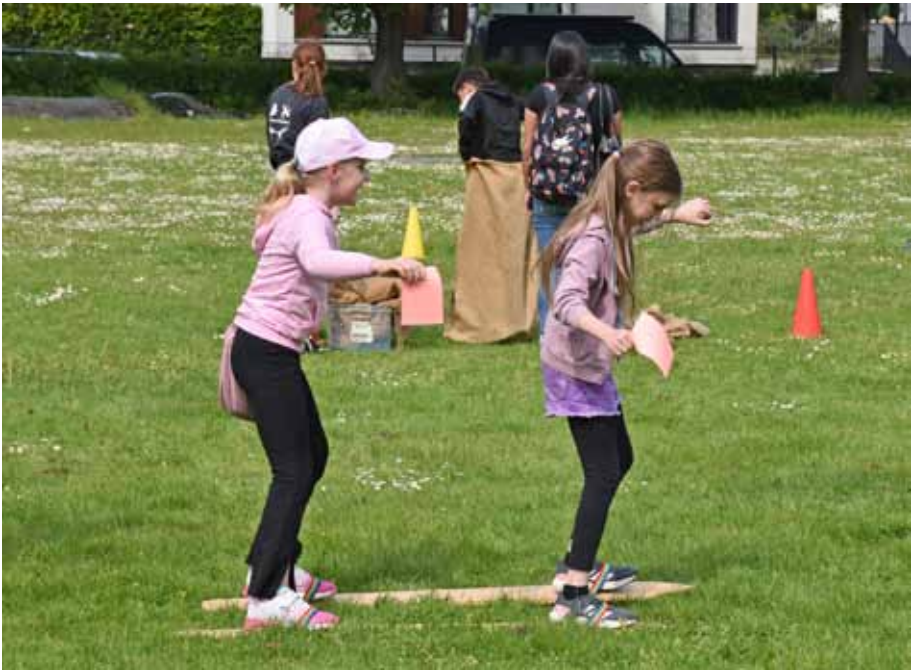
Mit viel Spaß und Lachen dabei - hier ist synchrones Laufen gefragt.