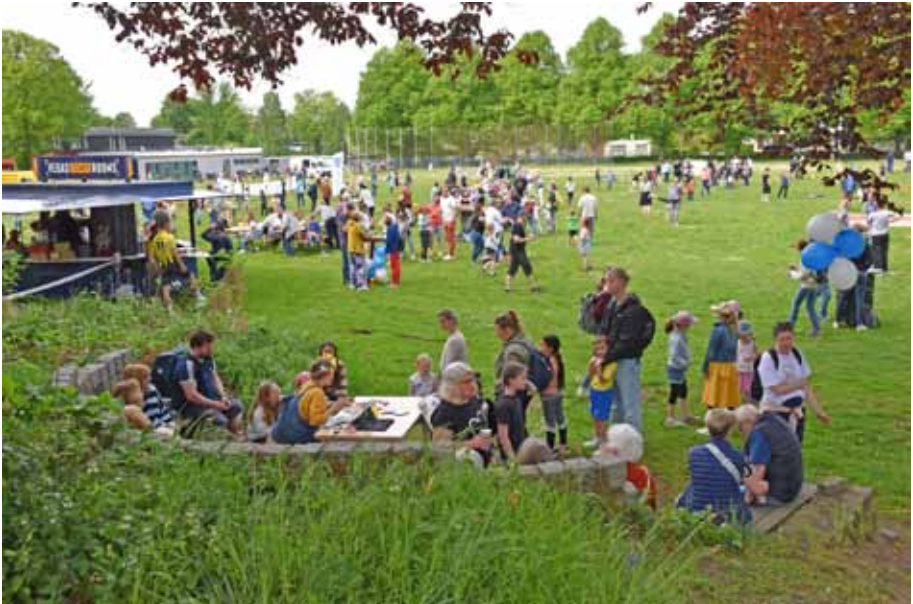
Das Angebot des LT-Erlebens bietet für alle etwas zum Mitverfolgen und Mitmachen.

Sport, Kreativität, Geschicklichkeit - es ist wieder soweit: Am Donnerstag, 9. Mai 2025 von 15:00 bis 18:00 Uhr, feiern wir unseren alljährlichen „Tag der offenen Tür – LT Erleben“ auf dem weitläufigen LT-Gelände.