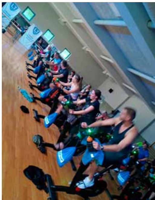
Mit Humor und Energie dabei: Treten, was das Zeug hält

Anmelden, ein Bike sichern – und auf geht's: Das 3. Indoor Cycling Event startet am Samstag, 13. September um 11 Uhr.