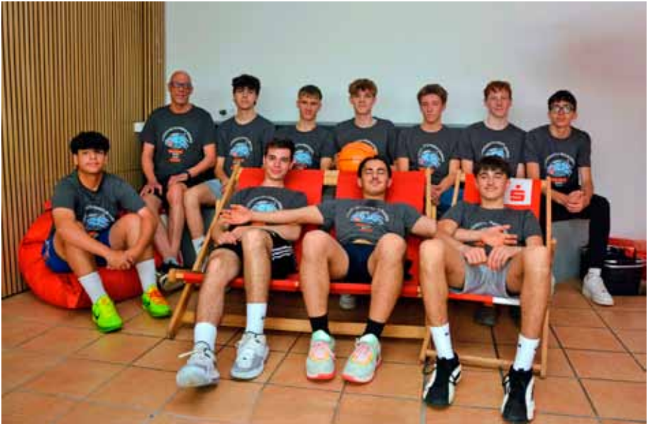
Leistungen werden honoriert im Rahmen des Mid-Sommar-Festes

Unser LT-Midsommer-Fest geht in die nächste Runde: Am Freitag, 27.06.2025 feiern wir mit Euch ALLEN auf dem LT-Platz und der Beach-Volleyball-Anlage, die mit Strand-Flair für das entsprechende sommerliche Ambiente sorgt.