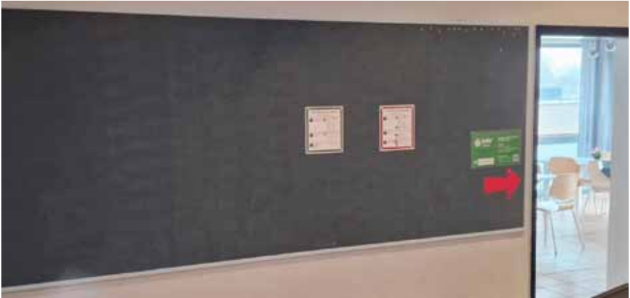
News und Infos an unserem „schwarzen Brett“ im 1. OG im LT-Gebäude